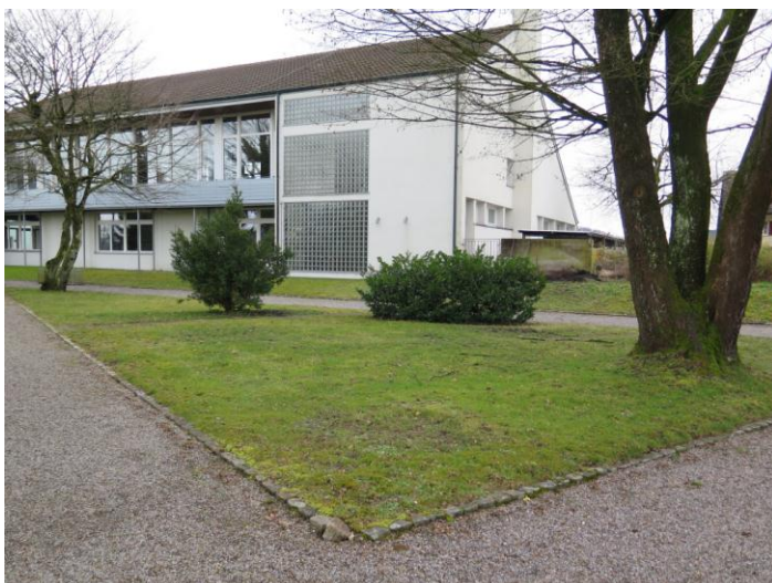
Standort des Kindergrabfeldes

Anders als bisher soll das Kindergrabfeld auf dem Friedhof Windisch einen eigenständigen Ort mit verschiedenen Bestattungsmöglichkeiten erhalten. Das Grabfeld liegt unmittelbar hinter dem Kirchgemeindehaus an der Achse Kirche - Schulhaus Dorf.